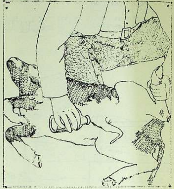
Debe desinfectarse el cordón umbilical con tintura de yodo, con el objeto de destruir microbios o gérmenes infecciosos.

Otra medida muy útil es la cauterización de los cachos antes de que éstos se desarrollen. La mejor época es cuando los terneros tienen una semana de edad. Primero se cortan los pelos del área y sobre el botón que indica el nacimiento del cuerno, se aplica, frotando vigorosamente, un lápiz cáustico de potasa cáustica o a base de otros preparados que se venden en el comercio.