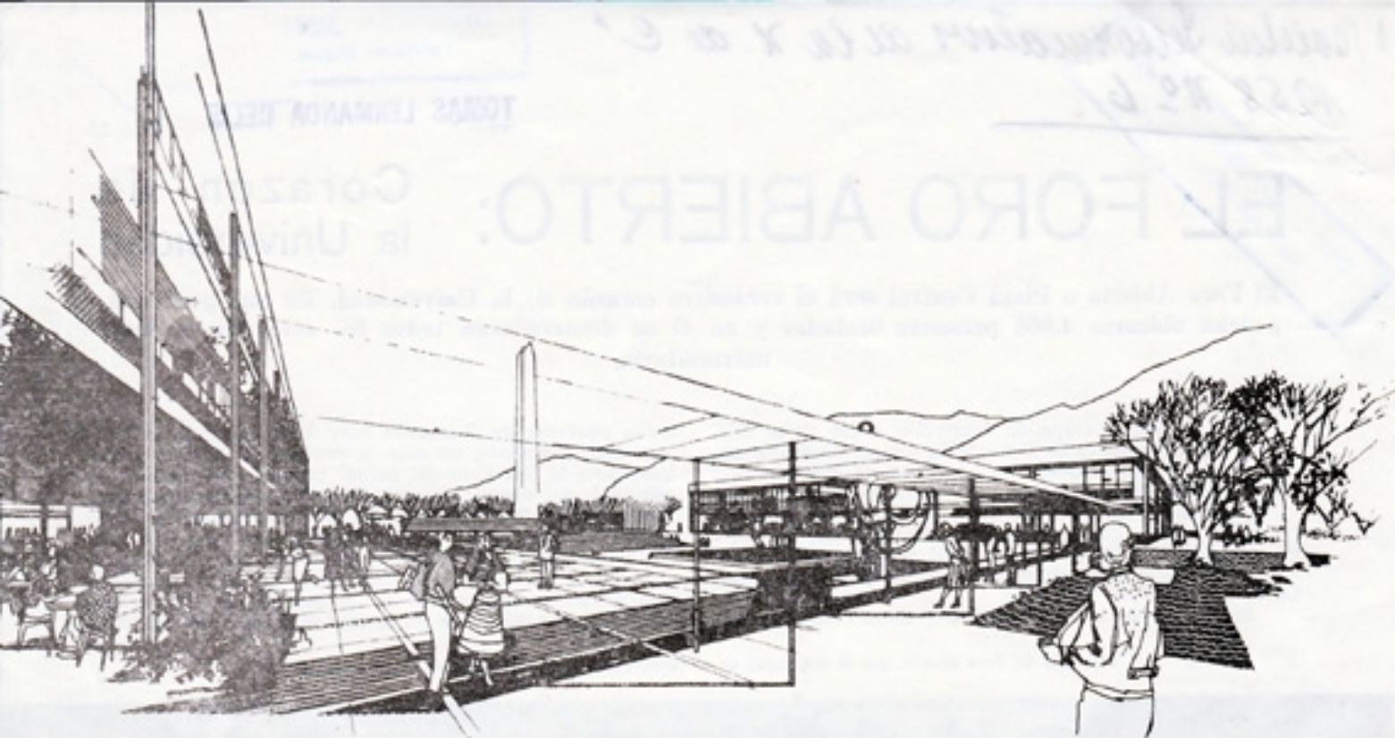
Dibujo del portal bajo el Instituto de Química y a la derecha, lo que será el edificio de la Biblioteca Central

Regional, en los terrenos pertenecientes a la Universidad de Concepción.