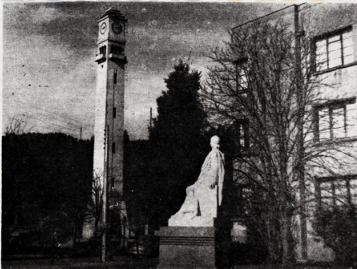
★ Rincón del barrio universitario de Concepción, destacándose al fondo el Campanil de la Universidad.

Estos son, en resumen, los aspectos principales de este Foro Abierto. Se considerará que su ejecución puede demorar y hacerse en etapas pero, en ningún caso deberá descuidarse el empleo de los materiales nobles que son los adecuados a la importancia, al carácter y a la permanencia del conjunto. Será el centro de atracción, el símbolo y la característica de la Universidad. La alegría y el goce que aporte, junto con la dignidad que imprima al Barrio Universitario, son valores que aunque intangibles tienen realidad y un alcance que compensan sobradamente el esfuerzo de su realización.